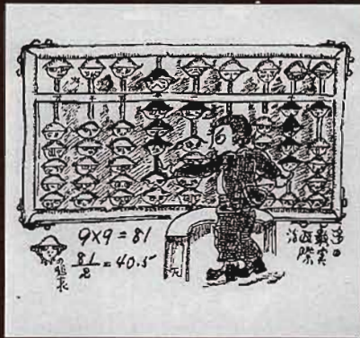
1922年(大正11年) 風刺小説「空中征服」の自筆挿し絵